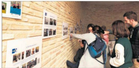
COMPROMISO. Los participantes forman parte de la actividad.