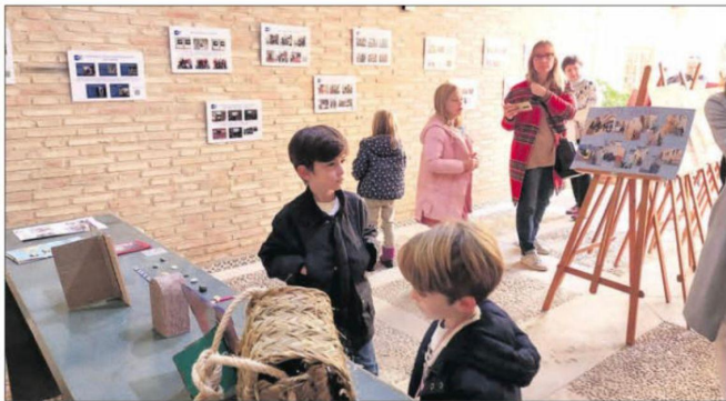
MUDEJAR. Los ciudadanos se acercan a la exposición del Camino Mozárabe de Jaén, que se encuentra en el Salón Mudéjar de la capital.